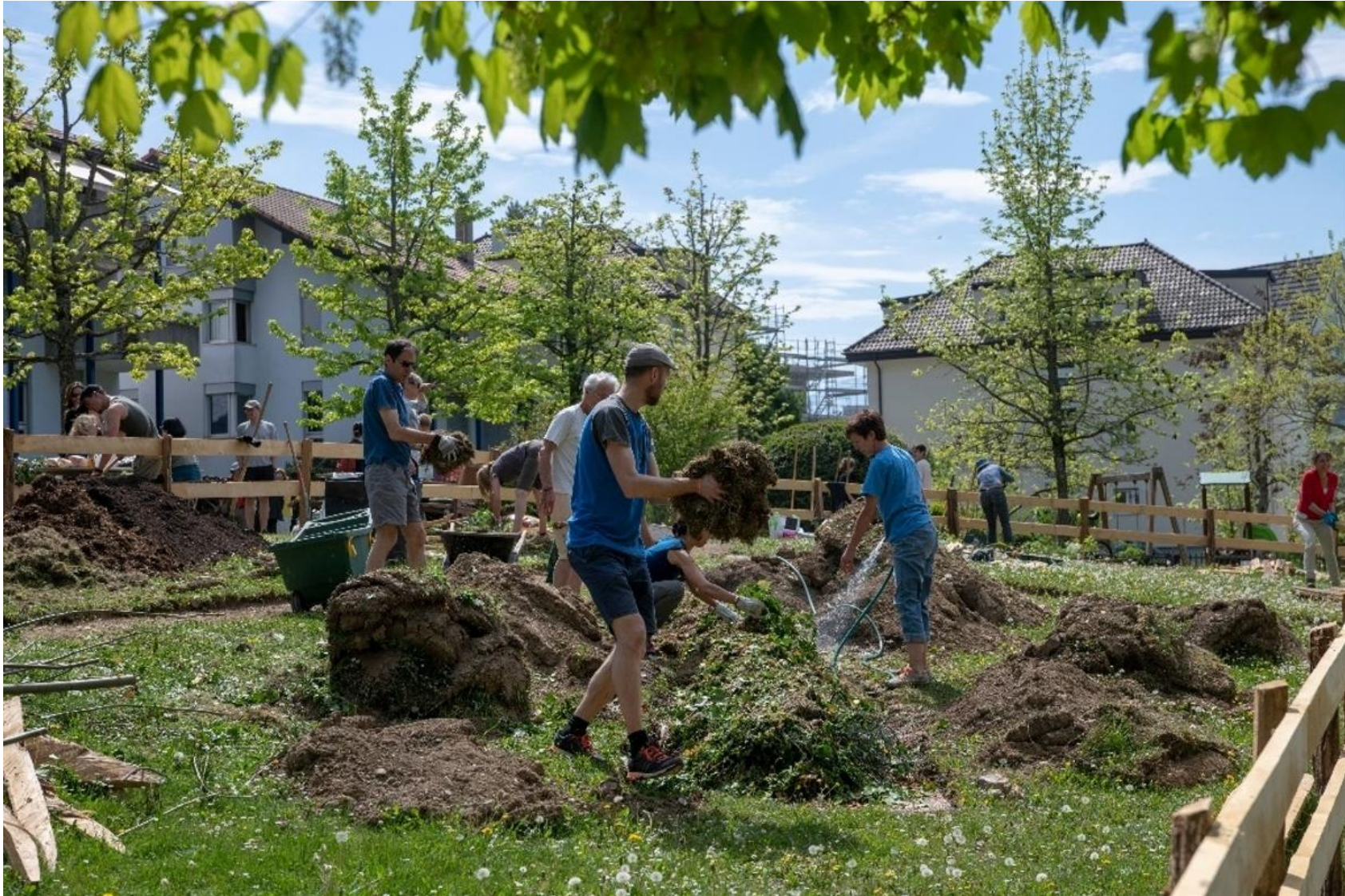
des potager collectif en permaculture à Pully, 02.05.2018